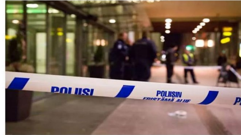
Nuoret tekevät rikoksia yhä enemmän ryhmissä. Poliisille tämä näyttäytyy niin, että yhdestä rikoksesta on epäiltyä useampia henkilöitä.

Poliisi on huolissaan espoolaisista alaikäisistä, jotka kauppaavat huumeita itsenäisesti ja tavoitteellisesti.