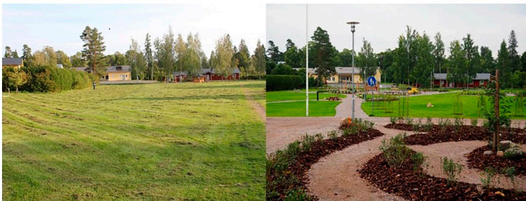
Kuva 5. Lukkaripuisto ennen ja jälkeen rakentamisen.

Yhteisöllinen hyvinvointipuisto kaikenikäisille. Lukkaripuisto sijaitsee keskeisellä paikalla kirkonkylässä. Se oli aiemmin laaja nurmikkoalue, joka haluttiin muuttaa kaikenikäisten ihmisten hyvinvointia edistäväksi kohtaamispaikaksi. Puiston suunnittelu toteutettiin osallistamalla kuntalaisia. Iäkkäitä asukkaita osallistui puistossa järjestettyihin arviointikävelyihin ja keskustelutilaisuuksiin. Myös muistisairaille asukkailla esiteltiin puiston kehittämismahdollisuuksia ja kerättiin heidän toiveitaan. Osallistamisen tuloksena syntyi suunnitelma, jonka perusteella puiston rakentaminen toteutettiin vuonna 2017. Muisti- ja ikäystävällisyys näkyy puistossa esteettömyytenä, toiminnallisena tilanjäsentelynä ja muistia aktivoivina ja paikallisuutta ilmentävinä elementteinä. Puiston kasvillisuus on monipuolista ja siellä on kohtaamis- ja levähdyspaikkoja sekä iäkkäille soveltuvia kuntoilulaitteita. (Rappe 2016.)