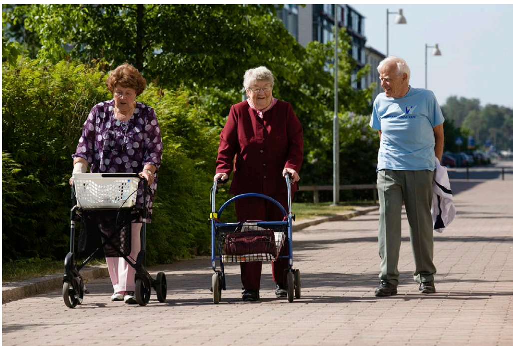
Kuva 6. Esteettömät kulkuväylät kuuluvat ikäystävälliseen ympäristöön.