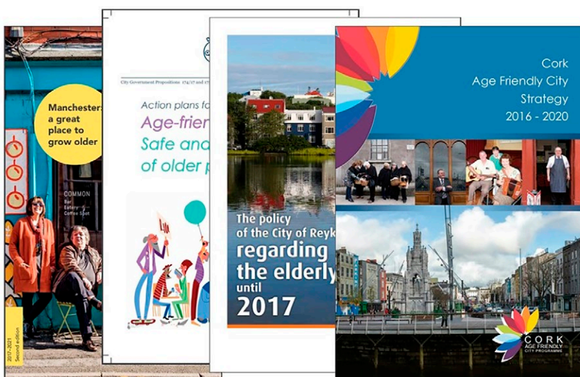
Kuva 2. Kaupunkien ohjelmia ikäystävällisyyden kehittämiseksi.

Koska ikäystävällisyyden kehittäminen on varsin kokonaisvaltainen ja siten myös väljä kehys, eri kaupungeissa siihen liitetään hajanaisesti erilaisia asioita, eikä niistä ole helppo saada selville, mistä ne ovat saaneet alkunsa. Ikäystävällisyys näyttäytyy kaupunkien suunnitelmissa usein erilaisina iäkkäitä ja muita kaupunkilaisia yhdistävinä tapahtumina ja kampanjoina, joissa osallistuminen ja osallisuus korostuvat. Asuinalueiden rakennetun ympäristön piirteet tulevat esille varsinkin silloin, kun iäkkäille tehdään kyselyitä ikäystävällisyydestä tai kaupungissa suunnitellaan mittareita ikäystävällisyyden arvioimiseksi. Joskus kaupunki on tarkastelussa kokonaisuutena ja joskus taas asuinaluekohtaisesti, jolloin rakennetun ympäristön piirteet ja paikalliset osallistumismahdollisuudet korostuvat.