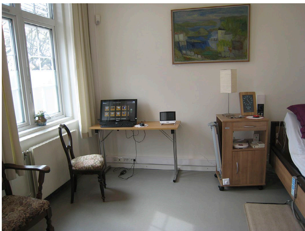
Kuva 4. Almas Hus

Muistiystävällisyyden kehittämisen osalta hyvä käytännön esimerkki on Almas Hus. Kyseessä on simuloitu muistiystävällinen asunto, joka toimii hyvinvointiteknologian keskuksena ja tarjoaa koulutusta muistiystävällisestä suunnittelusta ja teknologiasta kotiympäristössä. (Mt.) Oslossa on myös yksi kymmenen asunnon asuinrakennus (Welhavens street 5), jossa teknologian avulla kognitiiviselta toimintakyvyltään heikentyneet ja muistisairaat ikäihmiset voivat asua itsenäisesti ja turvallisesti (WHOj).