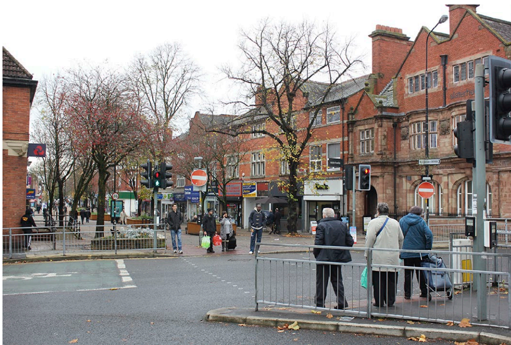
Kuva 3. Madallettu reunakivi suojatiellä helpottaa liikkumista.