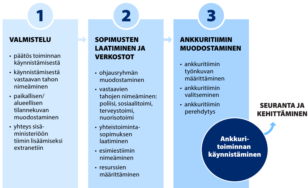
Kuvio 5. Ankkuritoiminnan paikallinen tai alueellinen käynnistäminen

Valtakunnallisesti tavoitteena on, että ankkuri toimii kaikilla alueilla ja kaikissa maakunnissa. Tällä pyritään varmistamaan, että nuoret ovat yhdenvertaisessa asemassa ankkuripalveluiden suhteen. Ankkuritoiminta perustuu yhteisille kansallisille toimintaperiaatteille, mutta se järjestetään vastaamaan paikallisiin ja alueellisiin tarpeisiin ja erityispiirteisiin. Ankkuritoiminnan suunnittelu ja organisointi alkavat paikallisesta, alueellisesta tai seudullisesta päätöksestä käynnistää moniammatillinen yhteistyö nuorten varhaiseen puuttumiseen, hyvinvoinnin edistämiseen ja rikosten ennaltaehkäisemiseen (Kuvio 5). Ankkuritoiminnan käynnistäminen edellyttää, että toiminta valmistellaan, laaditaan yhteistyösopimukset ja luodaan verkostot sekä muodostetaan ankkuritiimi ja varmistetaan sen toimintaedellytykset.