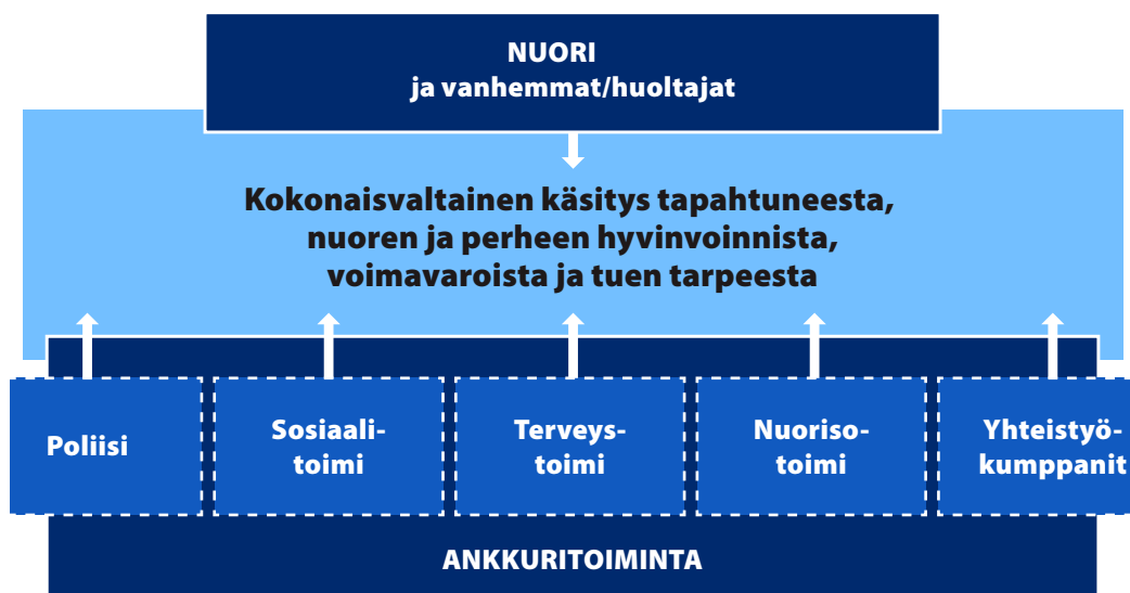
Kuvio 2. Kokonaiskuvan muodostaminen ankkuritoiminnasta

Ankkuritoiminnassa arvioidaan nuoren tilannetta. Tilanteen arviointi toteutetaan yhdessä nuoren kanssa, ankkuritoiminnan periaatteita kunnioittaen. Nuorelle voidaan myös tehdä ankkuritoiminnassa sosiaalihuollon palvelutarpeen arviointi, jos paikallisesti näin on sovittu. Arvioinnin periaatteita voidaan mukailla ja yhteistyötä tehdään muun sosiaalihuollon kanssa, vaikka viralliseen palvelutarpeen arviointiin ei olisi päädytty. Palvelutarpeen arvioinnin tavoitteena on tunnistaa nuoren tuen tarpeet. Ankkuritoiminnassa arvioinnin apuna voidaan käyttää erilaisia menetelmiä ja lomakkeita, jotka kohdistuvat nuoren kokonaistilanteen arviointiin sekä terveydentilan ja väkivaltaisuuden arvioimiseen (Liite 12).