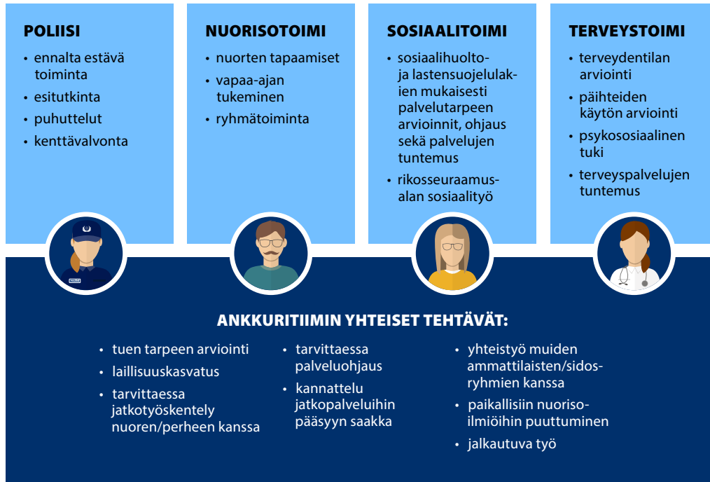
Kuvio 3. Ankkuritoimijoiden tehtävät

Ammattialakohtaisten tehtävien lisäksi ankkuritoiminnassa on kaikille yhteisiä tehtäviä, jotka kohdistuvat nuoren yksilöllisen tuen tarpeen arviointiin, laillisuuskasvatukseen ja nuoren tarpeenmukaiseen palveluohjaukseen tai jatkotyöskentelyyn nuoren ja/tai perheen kanssa (Kuvio 3).