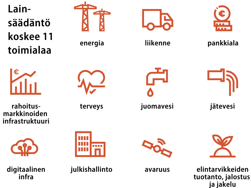
Kuvio 1. CER-toimialat

Valvovat viranomaiset valvovat kriittisille toimijoille määrättyjen velvoitteiden noudattamista ja tukevat riskienhallinnan kehittämistä. Lisäksi valvovat viranomaiset ja Finanssivalvonta kehittävät ja tukevat kriittisten toimijoiden häiriönsietokykyä yhteistyössä toimialaministeriöiden ja Huoltovarmuuskeskuksen kanssa.