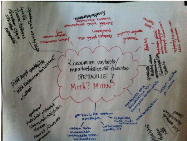
Kuva 5. Kaikki kirjoitukset purettiin harjoituksen jälkeen.

Kaikki, mitä nuorten kanssa saatiin aikaiseksi, kirjattiin vielä muistiin jatkoa varten. Tämän jälkeen alkaa työ työryhmässä johon kaikki toimijat kuuluvat. Tästä eteenpäin ajatukset jalostetaan ja niistä tehdään toimintasuunnitelma tulevaisuutta ajatellen.