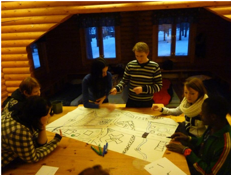
Kuva 6. Nuoret piirsivät unelmakaupunkinsa.

Projektin tavoitteena oli luoda toimintamalli, jolla voidaan puuttua yläkouluissa tapahtuvaan kiusaamiseen ennalta ehkäisevästi sekä toimia tehokkaasti ja oikein kiusaamistapauksissa. Olemme tässä työssä vielä vasta alussa pilotoinninkin suhteen, mutta suunta on jo oikea. Olemme saaneet paljon materiaalia nuorten näkemyksistä ja kokemuksista ja heidän toiveistaan olojen parantamiseksi. Projektiryhmän kesken ajatuksia on jalostettu eteenpäin.