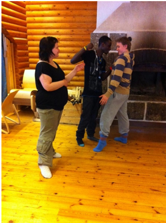
Kuva 2. Näytelmät olivat osa asioiden käsittelyä leirillä; tässä esitetään kiusaajaa ja kiusattua sekä opettajaa.

Leiristä jäi kaiken kaikkiaan käteen paljon ajatuksia ja paljon paperille piirrettyjä kaavioita selityksineen. Saimme nuorten kanssa enemmän aikaiseksi kuin osasimme kuvitellakaan ja tästä pääsimme jatkamaan aiheen työstöä seuraavassa tapaamisessa. Nuoret lähtivät kotiin kotiläksyjen kera, väsyneinä ja kaikkensa positiivisessa mielessä aiheelle antaneina.