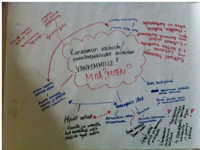
Kuva 3. Asioita mietittiin monin eri keinoin.

Kolmas tapaaminen oli jälleen nuorisotilassa jonne kaikki kokoontuimme pohtimaan leirillä aikaansaatuja asioita ja syventämään jo muistiin kirjattua. Jaoin porukan kolmeen osaan, ja he saivat poliisin tai nuoriso-ohjaajan avustuksella ja tuella miettiä yhdessä toimia mitä voisimme tehdä asioiden muuttamiseksi. Aikaansaadut tuotokset käytiin vielä yhdessä läpi ja mietittiin, ovatko ne todella toteuttamiskelpoisia ja jos ovat kuka näitä asioita voisi lähteä viemään eteenpäin.