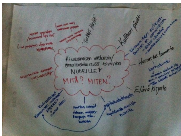
Kuva 4. Jokainen sai kirjoittaa ajatuksiaan.

Myös aihepiirit jaettiin kolmeen osaan: vanhemmille, opettajille ja nuorille itselleen. Miten voitaisiin toimia kiusaamisen kitkemiseksi ja ennalta ehkäisemiseksi?