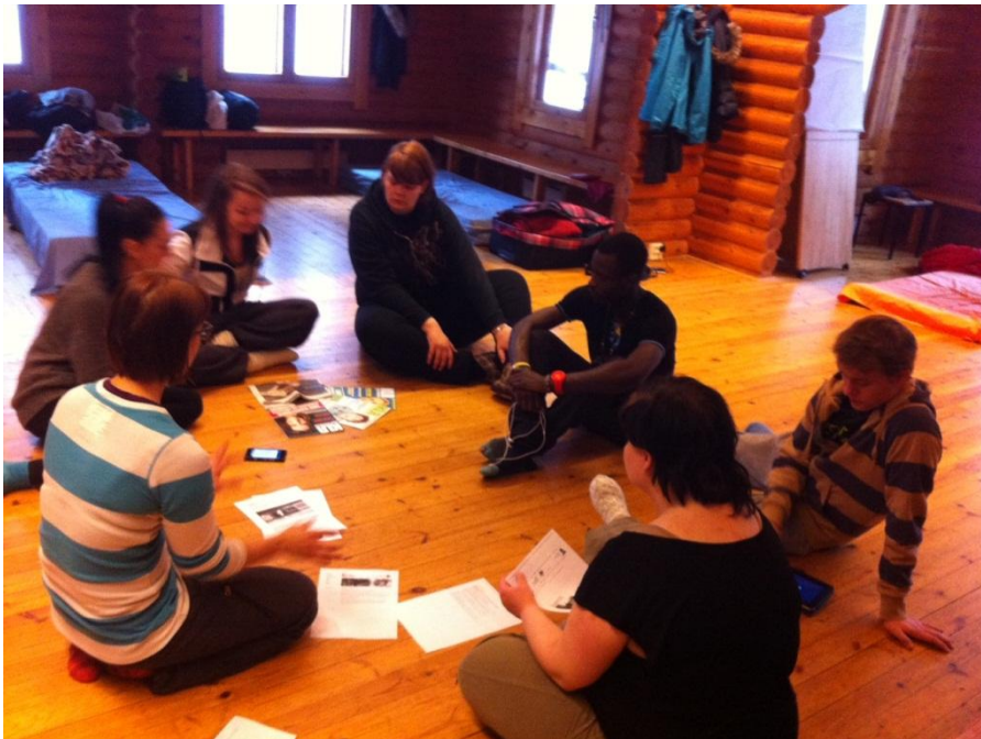
Kuva 1. Nuoret pohtivat vaikeita kysymyksiä erilaisten tehtävien avulla.

Leirin ensimmäinen ilta käytettiin ryhmäytymiseen. Lahden nuorisopalveluiden ohjaajat olivat suunnitelleet tehtäviä joissa nuoret toimivat yhdessä ja samalla tutustuivat toisiinsa. Tehtävissä sivuttiin jo aihettamme muun muassa näytelmien keinoin. Nuoret olivat välillä kiusatun, välillä kiusaajan roolissa ja näin käsittelivät aihetta jo lähes huomaamattaan. Tunnelma oli vapautunut ja kaikilla oli mukavaa. Ruoka tehtiin myös porukalla ja ilta meni leppoisasti puuhastellen. Iltakeskustelussa purettiin päivän tehtäviä ja tarkoituksena oli mennä kiusaamisaiheeseen varovasti ja vähän kerrallaan. Porukka oli kuitenkin jo tullut toisilleen niin tutuiksi, että keskustelu oli avointa ja vapaata. Jokainen jakoi omia tuntojaan ja muutama kyynelkin vierähti asioita muistellessa ja muille kertoessa. Tässä vaiheessa tiesimme että olimme valinneet oikeat nuoret ryhmään ja olimme varmoja tavoitteiden saavuttamisesta.